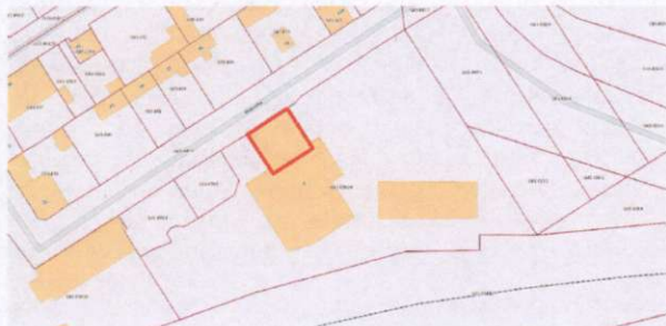
Plan sytuacyjny posesji przy ul. Henryka 8 z oznaczeniem granic ochrony obiektu.