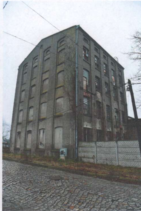
Widok ogólny budynku z kierunku pñ.- zach.