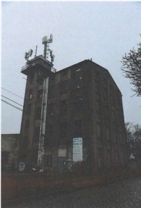
Widok ogólny budynku z kierunku pñ.- wsch.