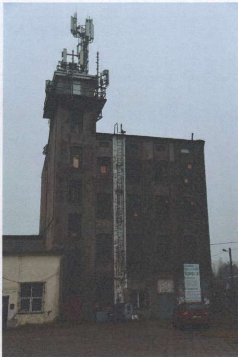
Elewacja boczna, pñ.-wsch., widok ogólny.