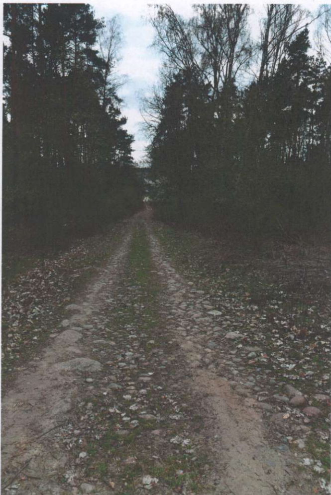
Widok ogólny drogi z kierunku północnego (od strony pół)