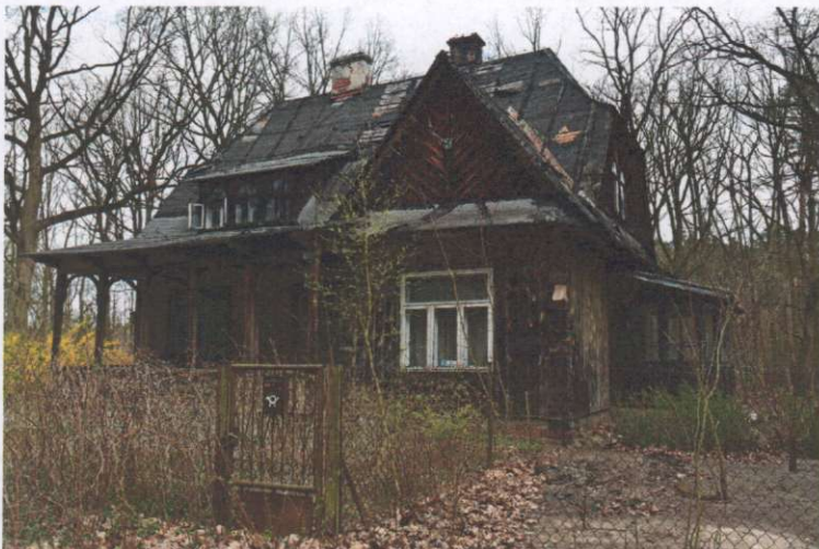
Widok ogólny od strony frontowej (z kierunku południowo-zachodniego)