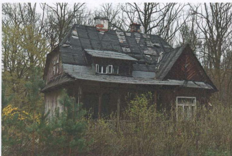
Widok ogólny od strony frontowej (z kierunku północno-zachodniego)