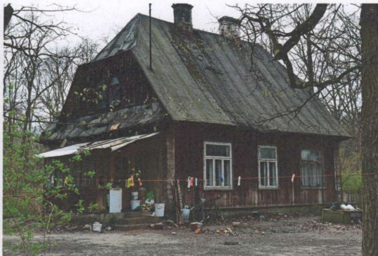
Widok ogólny z kierunku południowo-wschodniego.