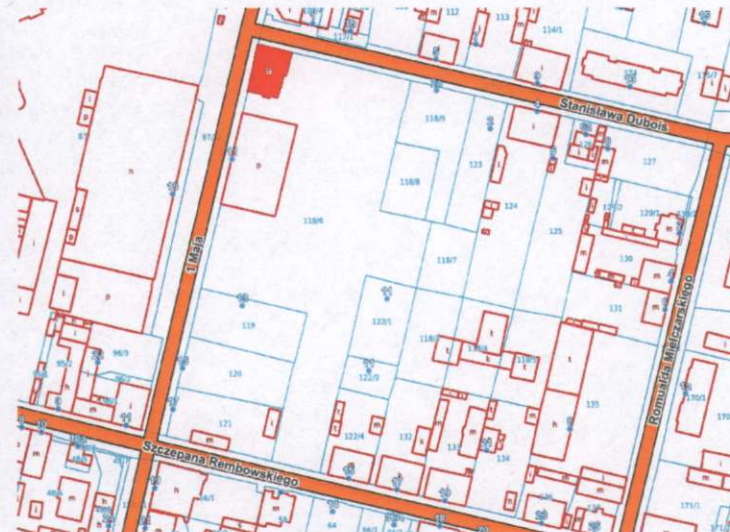
Plan orientacyjny z oznaczeniem lokalizacji budynku