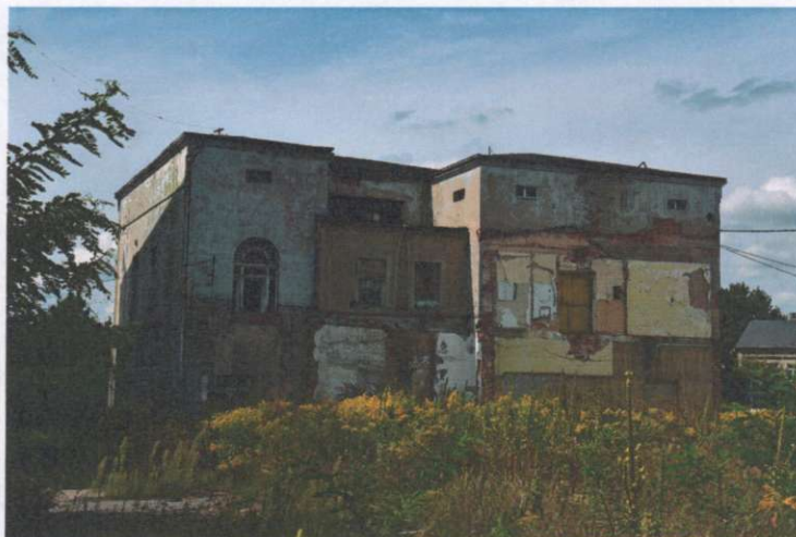
Widok ogólny budynku z kierunku połd.-wsch.