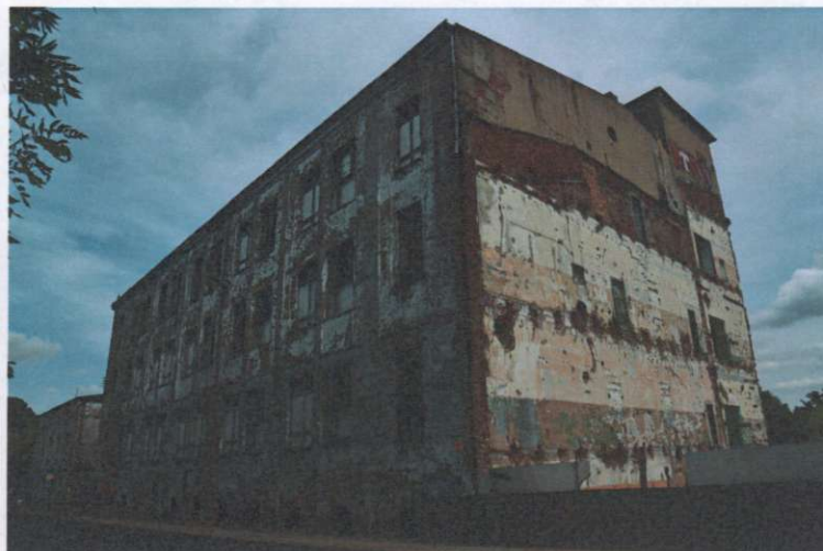
Widok ogólny budynku z kierunku półd.-zach.