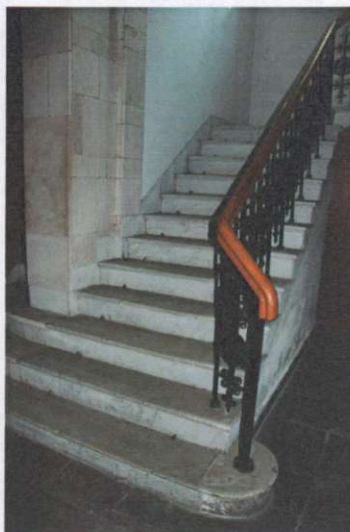
Klatka schodowa, parter