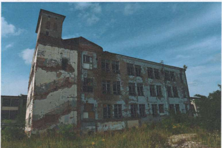
Widok ogólny budynku z kierunku zach.