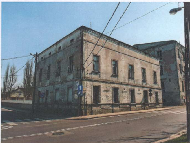
Widok ogólny budynku z kierunku półn.-zach.