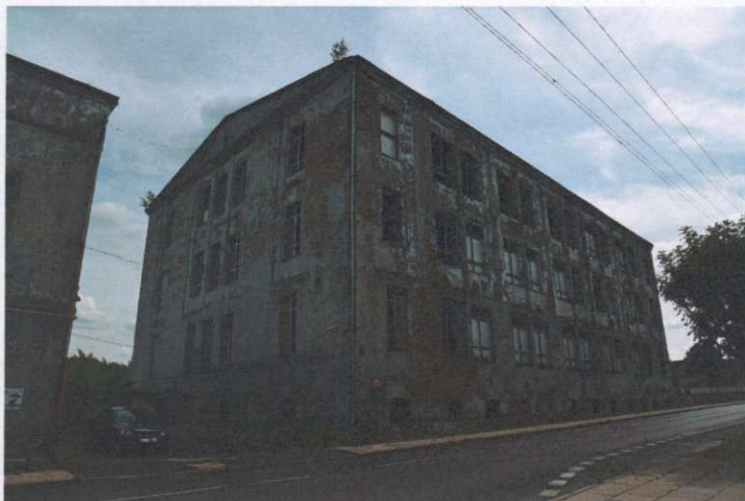
Widok ogólny budynku z kierunku półn.-zach.