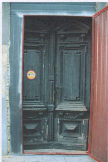
Drzwi wejściowe do budynku