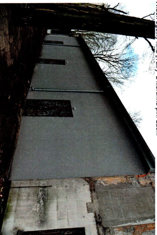
Wschodnia część kina „Tatry”, widok z kierunku pn.-zach.