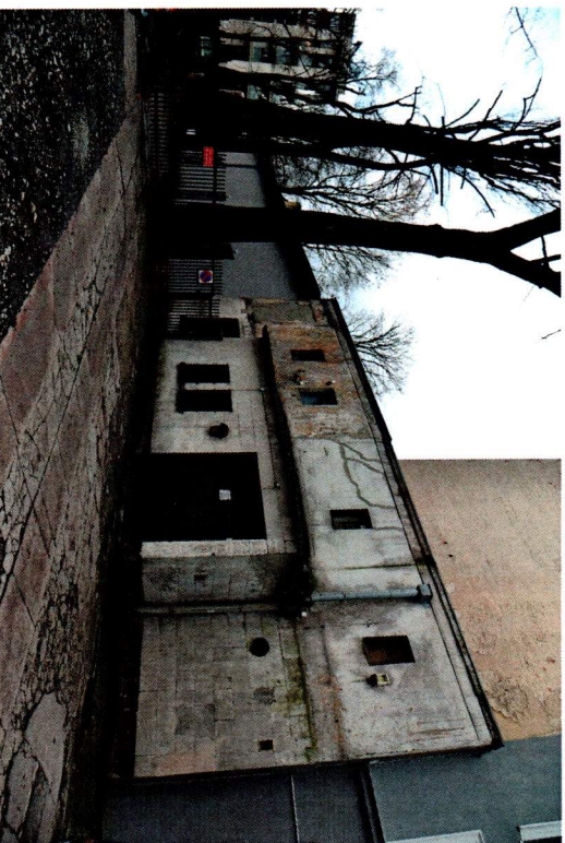
Widok ogólny kina „Tatry” z kierunku pn.-zach.