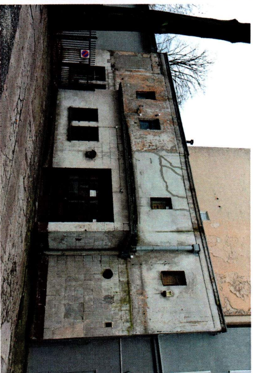
Zachodnia część kina „Tatry”, widok z kierunku pn.-zach.